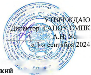
График промежуточной аттестации на группы ГД-3-22 профессии 54.01.20 Графический